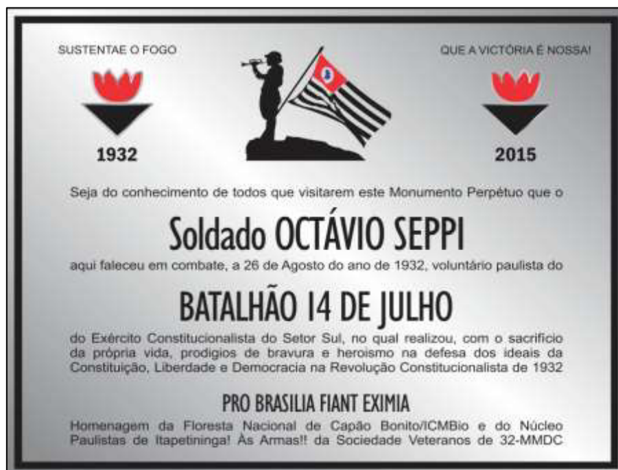
Foto 6. Placa a ser descerrada no Monumento a Octávio Seppi em 8 de julho de 2015 na Flona

Para tanto, a Sociedade Veteranos de 32-MMDC, nas suas sucursais de Itapetininga e Buri, irão realizar em parceria com a FLONA de Capão Bonito (vide documento em anexo) a solenidade de reinauguração do Monumento Octávio Seppi e de descerramento de nova placa que ornamentará este monumento, a 8 de Julho de 2015 , quarta feira, às 14 horas , na referida FLONA em local onde existe o monumento.