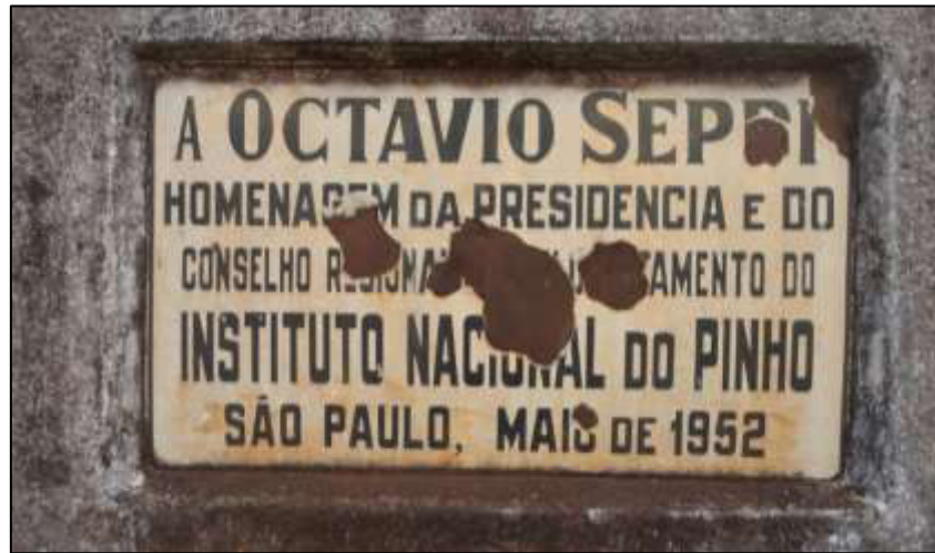
Foto 5. Detalhe da placa existente no Monumento à Octávio Seppi