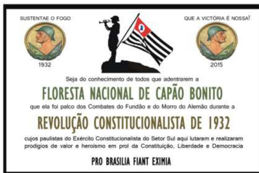
Foto 1. Placa oferecida à FLONA de Capão Bonito declarativa da condição de teatro de operações deste órgão federal na Revolução de 1932.